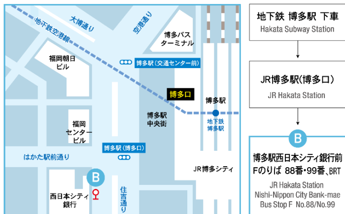
A 博多駅周辺 MAP Hakata Station Area Map